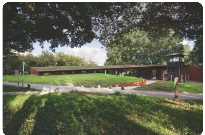
Kamp Amersfoort Nu