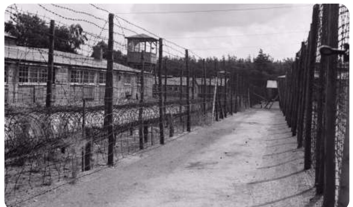
Kamp Amersfoort - toen