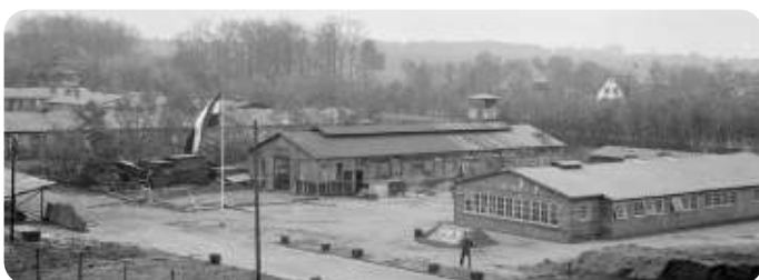
Kamp Amersfoort - toen